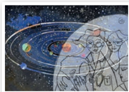
Immagine a cura di Art Department SIGG

S.I.G.G. – Società Italiana di Gerontologia e Geriatria Via G.C. Vanini, 5 - 50129 Firenze Tel +39 055 7096122 sigg@sigg.it - www.sigg.it